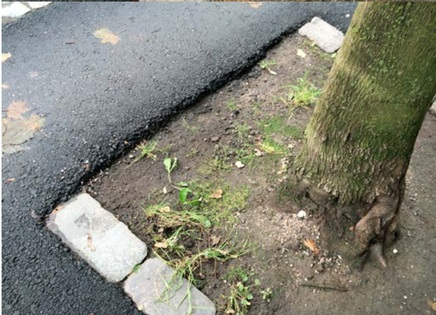
Loivia ja jyrkkiä pudotuksia. Kun tästä pimeällä ajaa, todella pelottaa.