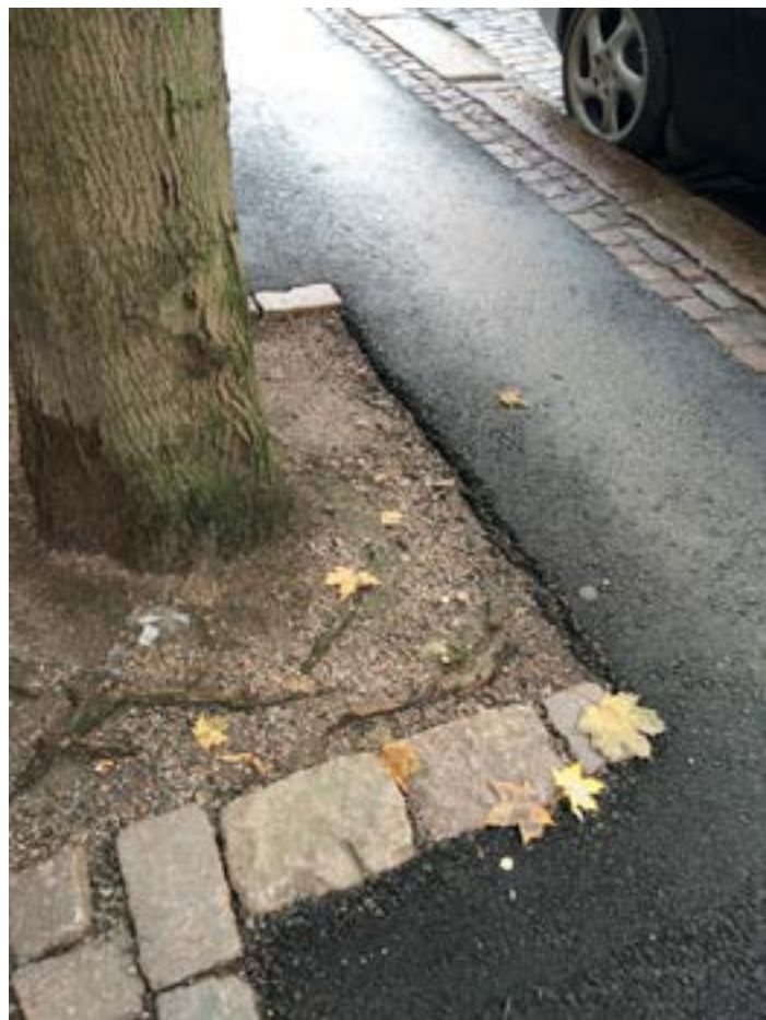
Tasottavista ritilöistä on vain muistot jäljellä.