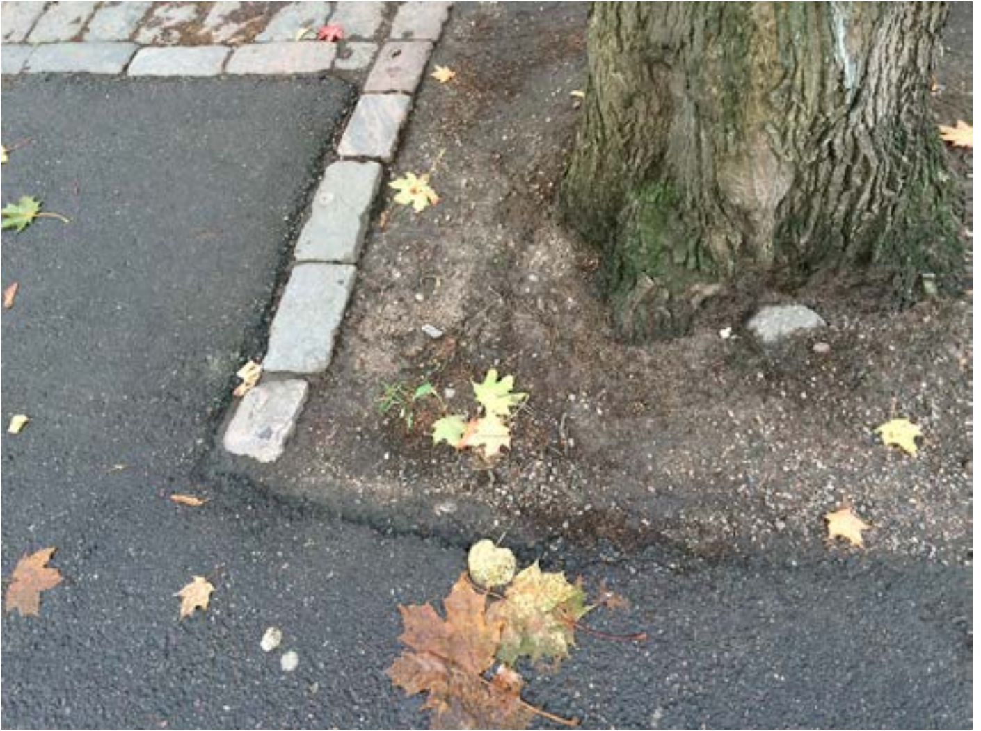
Pienikin äkkipudotus (3-5 cm) puun juurella voi johtaa suuriin vammoihin, kun tilaa on liian vähän.