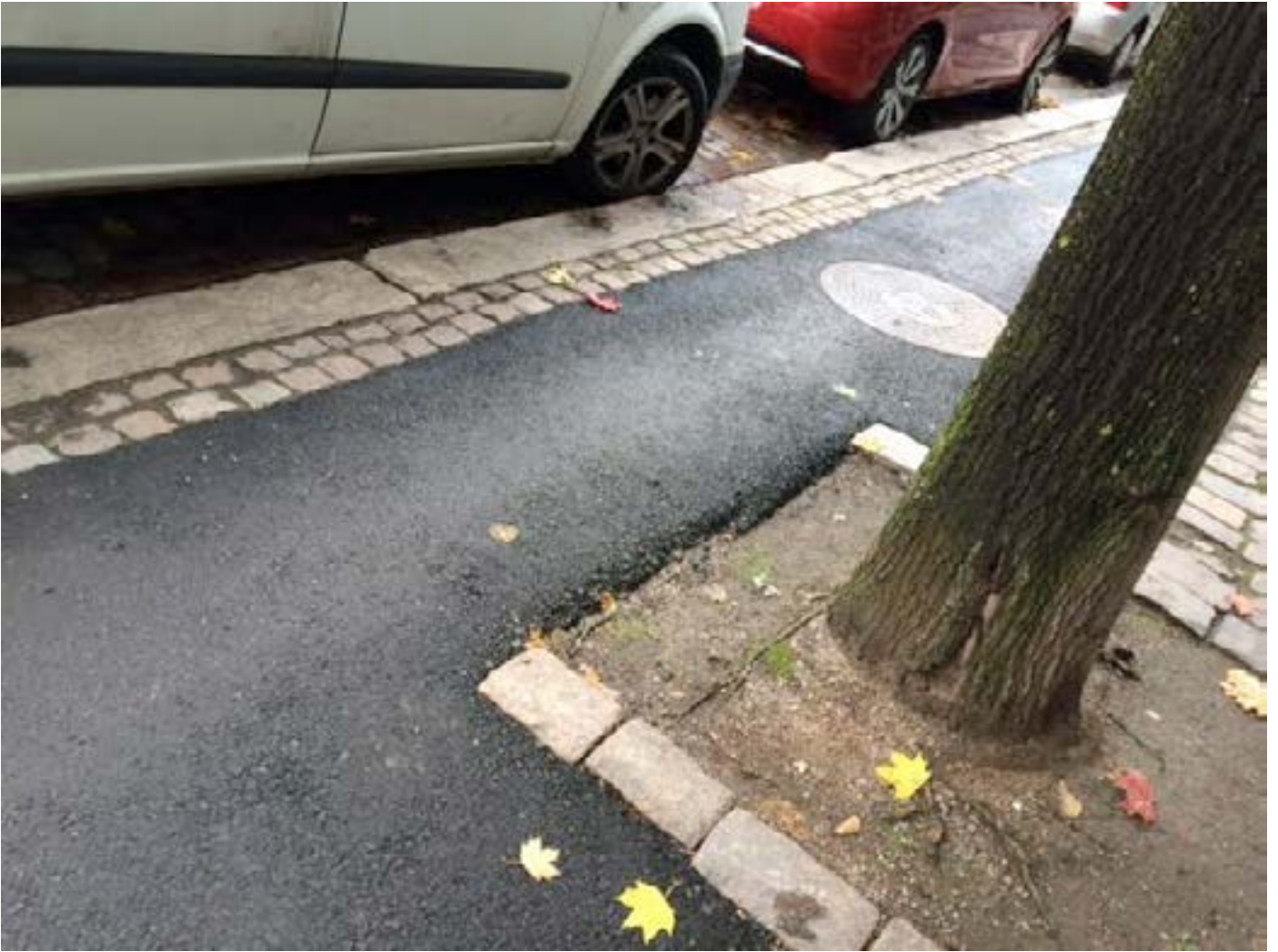
Pyörätie on paikoitellen alle metrin leveä. Turvalliset ohitukset mahdottomia.