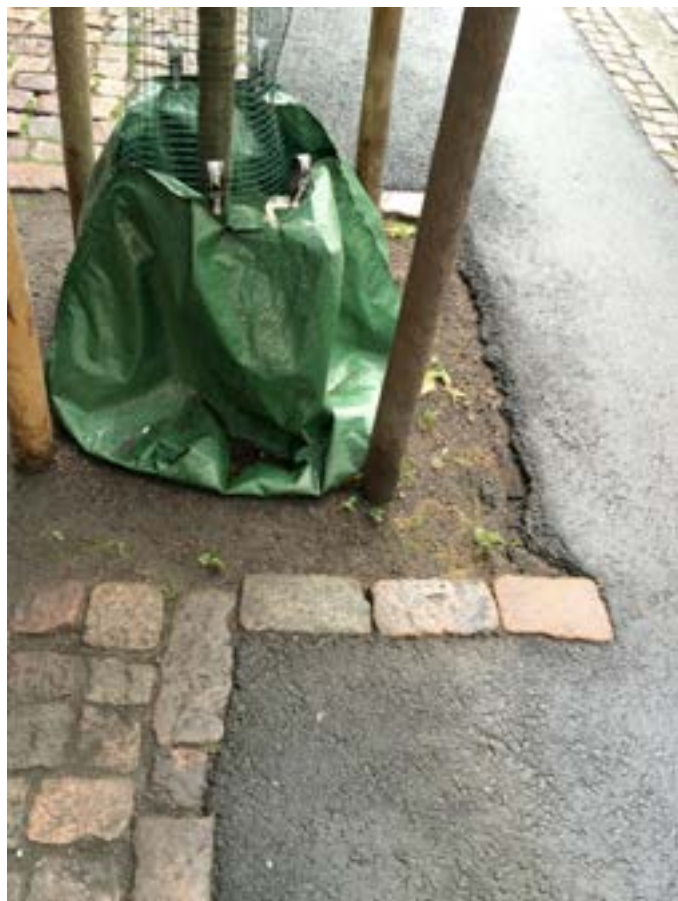
Pyörätie puiden kohdalla on n. 80 cm. Toisella puolella parkkeeratut autot.