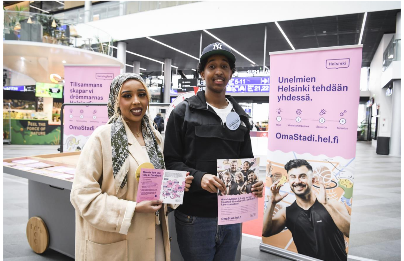
Äänestyspaikka Triplassa vuonna 2021.